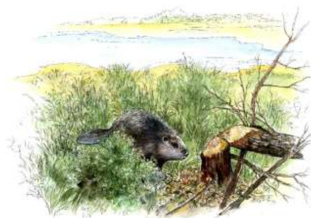
Castor d'Europe

En amont, les secteurs de sources du massif central abritent tourbières et petits ruisseaux : royaume de la Loutre, des plantes carnivores (Rossolis) et du Cincle plongeur. Dans les gorges, les forêts et landes des rives sont propices à la présence de nombreux rapaces. Plus à l'aval, les secteurs de méandres et d'îles abritent la plus importante population française de sternes qui nichent sur les bancs de sable. Les forêts riveraines, jungles en miniature, servent de zone d'alimentation pour le Castor d'Europe. Enfin, vers l'estuaire, les prairies agricoles sont de véritables zones refuges pour une diversité de fleurs, de papillons, et pour un oiseau très menacé, le Râle des genêts. La richesse du bassin de la Loire est aussi majeure dans le milieu aquatique : poissons migrateurs dont le saumon atlantique, mollusques en raréfaction comme la moule perlière, écrevisse à pieds blancs, etc. sont le reflet d'un patrimoine biologique fragile et remarquable. C'est parce que le bassin versant de la Loire présente cette extraordinaire diversité qu'il constitue un enjeu majeur pour la préservation de la nature à l'échelle européenne. Au delà de cette diversité, le cours du fleuve représente un extraordinaire trait d'union entre l'amont et l'aval, en permettant la circulation des espèces sauvages et les échanges entre des milieux très divers.